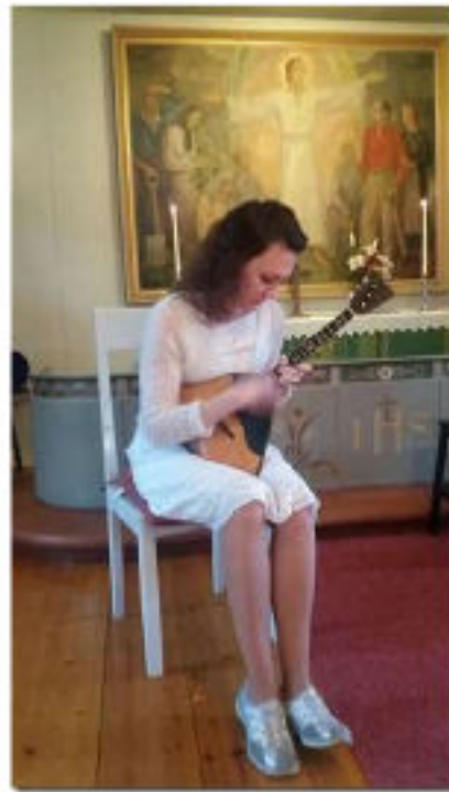
Firande av Lansjärv kyrka 75 år