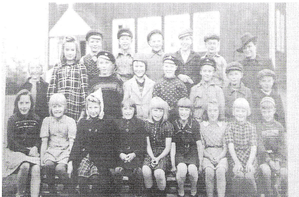
Elever vid Lansjärv skola f 1934-36